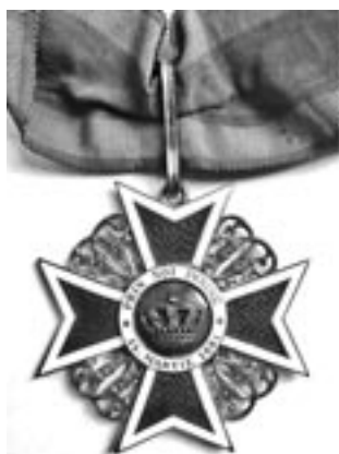
Ordinul „Coroana României” în gradul de Comandor (avers și revers)